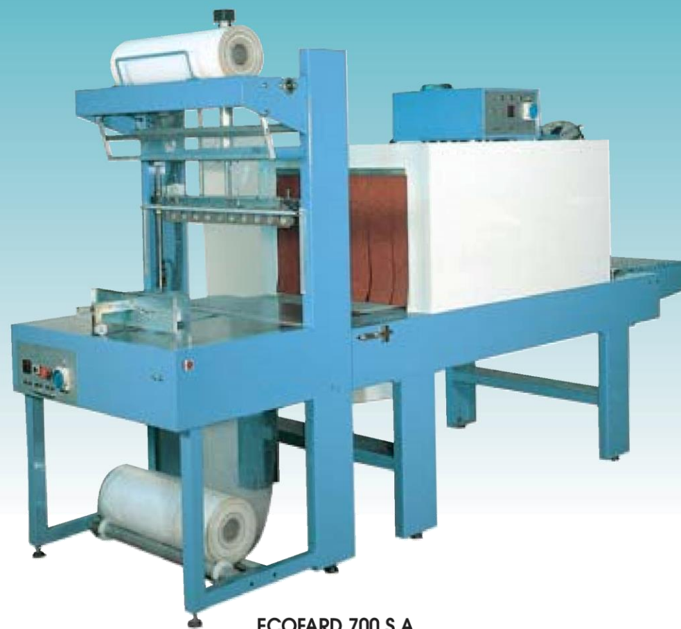
ECOFARD 700 S.A.