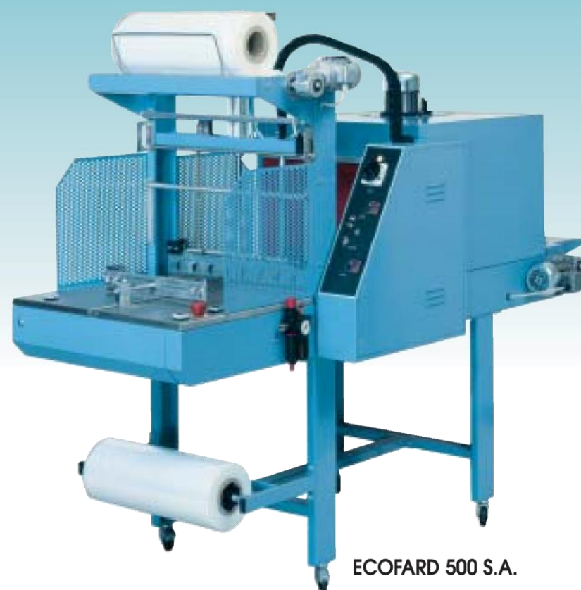
ECOFARD 500 S.A.