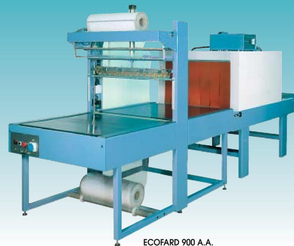
ECOFARD 900 A.A.