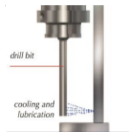
Refroidissement : lubrification