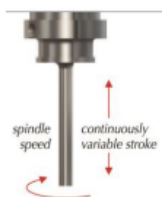
Vitesse réglables : rotation / descentes