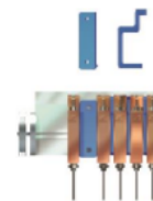
Cales montage rapide

Le système de descente par came garantir une précision constante et augmente ainsi la durée de vie des forets. Précision de réglage de descente : 0,1 mm.