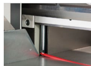
Ejecteur de réglettes de coupe. Facilite et accélère le changement de lame.