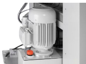
Système hydraulique embarqué avec puissante double pompe. Garanti un fonctionnement sûr et durable.

Les massicots MOHR bénéficient de l'important avantage technologique des grandes machines de la marque.