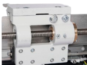
Roulement à billes linéaire. Exempt d'entretien et extrêmement précis.