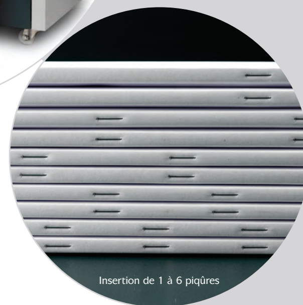
Insertion de 1 à 6 piqûres