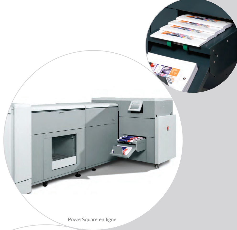
PowerSquare en ligne

Il n'y a pas de durée de préchauffage, donc la machine est toujours prête à fonctionner.