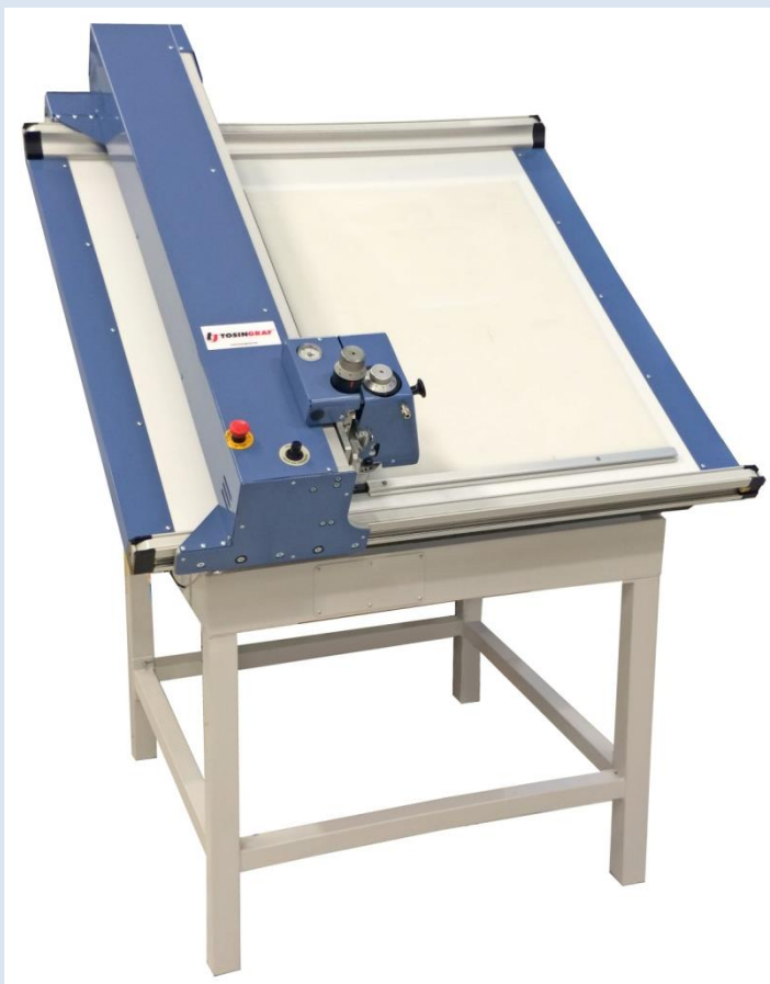
Table de découpe DAO avec V software Découpage, rainage, micro-perforation, gaufrage, dessin.

Fabrication de packaging, maquettes en blanc, étiquettes, faire-part...de petites séries.