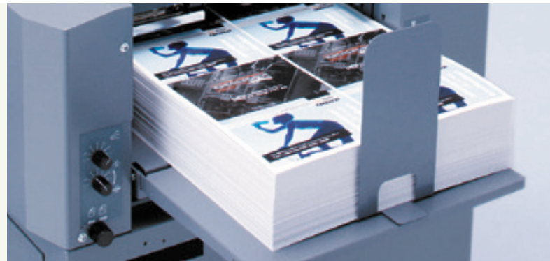
Margeur grande capacité