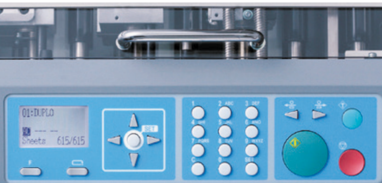
Afficheur à écran tactile