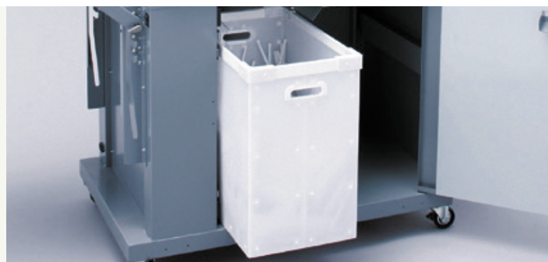
Bac de récupération grande capacité