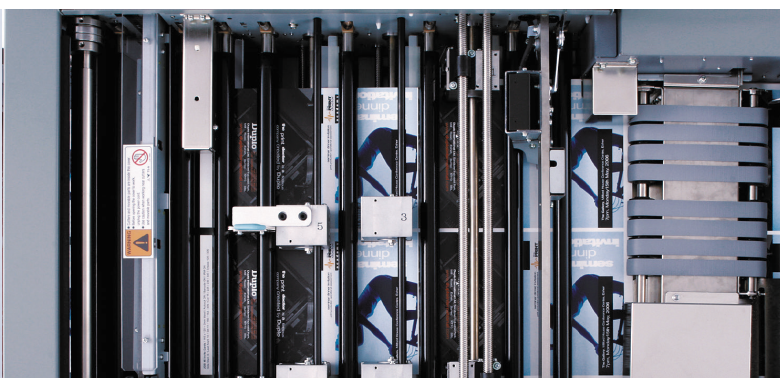
Modules de traitement

L'assistant du logiciel Contrôleur PC permet aux opérateurs de créer facilement de nouveaux travaux, d'effectuer les réglages et de mémoriser jusqu'à 80 travaux sur la machine et un nombre pratiquement illimité dans la mémoire du PC, pour des changements de travail plus rapides. Il offre également une bibliothèque de modèles PDF. Ces modèles peuvent être utilisés pour lancer immédiatement en production des applications courantes, comme les cartes de visite, les tickets, les cartes postales et les cartes de vœux. La bibliothèque correspondante des jobs préprogrammés est également fournie afin de faciliter et d'accélérer le démarrage.