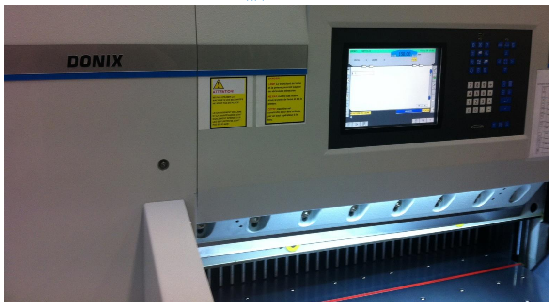
Changement de lame assisté avec dispositif de montage ultra-rapide (brevet Allemand)

Le double guidage de l'équerre sur deux crémaillères (droite et gauche) permet de supprimer le trou central sur la table arrière. Ceci évite la dépose de copeaux de papier sur la vis sans fin et supprime ainsi les réglages intempestifs de l'équerre. Le programme avec un écran tactile, comprend toutes les fonctions additionnelles permettant une meilleure productivité.