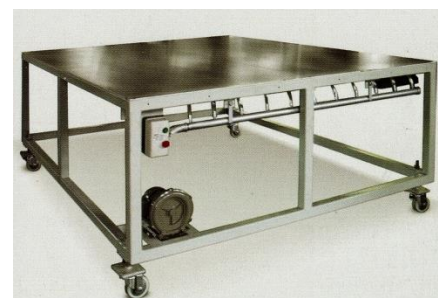
Table soufflante mobile + moteur soufflerie