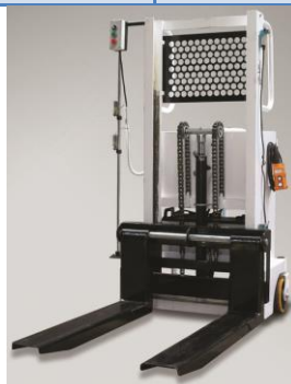
Elévateur mobile EME