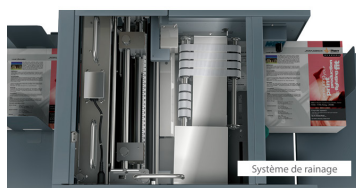
Système de rainage