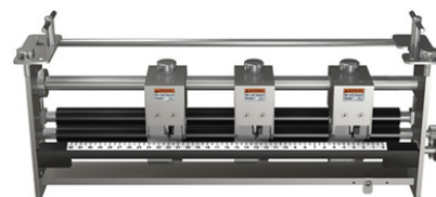
Module optionnel : coupe et micro perforation