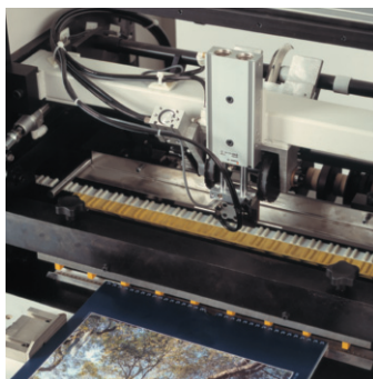
BB50/H Central hanger feed system Dispositivo de colgadores central BB50/H Distributeur de crochets central BB50/H Zentrale Aufhängerzuführung