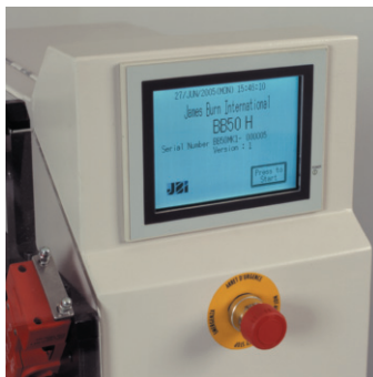
User-friendly control Panel de control táctil de fácil manejo Ecran de contrôle digital facile d'utilisation Benutzerfreundliche Bedienung