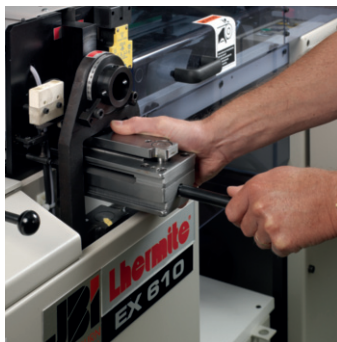
Easy tool change over Cambio de peines rapido Changement d'outil rapide Schneller Werkzeugwechsel