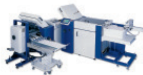
NET 52/4/4/MS 45