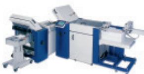
NET 52/4/4 SKM 36