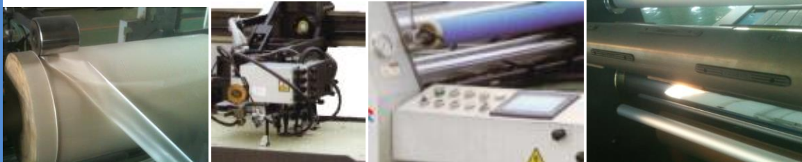
Découpe du film / Margeur type offset / Ecran tactile / serrage pneumatique de la bobine