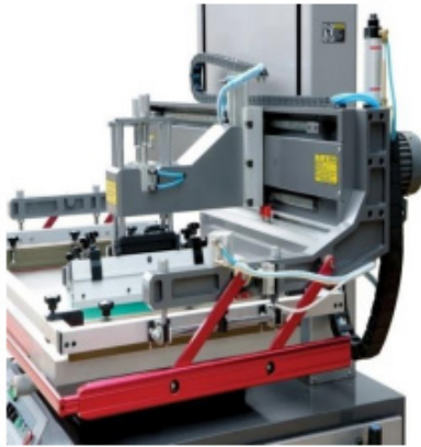
Barre de sécurité CE